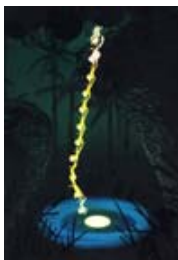
« les singes qui veulent attraper la lune » : papiers de murier peints et déchirés

A chaque titre, faire correspondre une image et rechercher ou expérimenter son moyen de réalisation plastique qui sera observé plus finement lors de la projection :