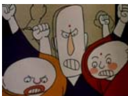
« les trois moines » : dessin animé peint à la gouache.