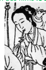
flûte chinoise à écouter sur le site

http://fr.clearharmony.net/articles/200502/18203.html avec ce lien http://media.zhengjian.org/media/2004/12/09/YuGeZhi.ram et le Sheng sur le site