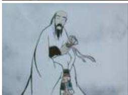
« impression de montagne et d'eau » : lavis animé, peinture chinoise traditionnelle à l'encre de Chine et aquarelle.

A l'aide de chacun de ces photogrammes et des titres, imaginer les couleurs du film correspondant, le décor, le temps du film.