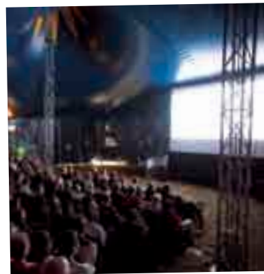
Le Louxor: Gindou 2007

Un journal sonore quotidien, de 4 minutes environ qui se déguste comme une friandise... réalisé par Frédéric Rouziès et Sophie Cammas, à écouter sur le site Internet des Rencontres Cinema tous les jours à partir de 17h00 et sur le lieu du festival avant les tchatches.